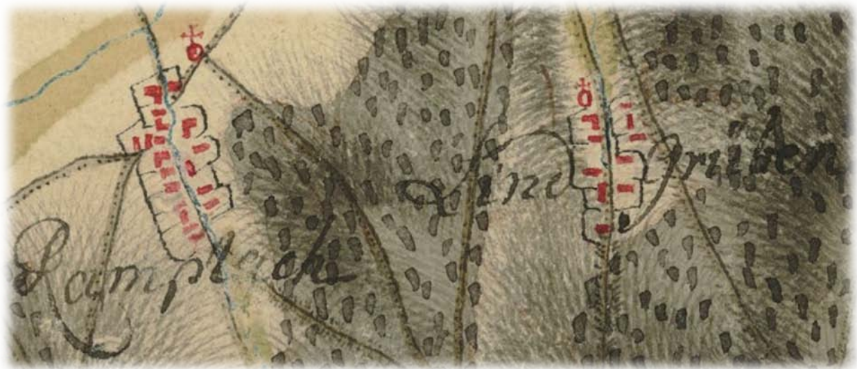
Dieser Ausschnitt aus der Josephinischen Landesaufnahme zeigt Lindgrub Während des Zeitraumes von 1773 bis 1781 7

„Lindgruben und Unter Tanneck hinter Neukirchen, dahin sie eingepfarret sind, zwischen Ober Tanneck und Wartmannstetten gelegene 6 , mit einander verbundene und der pergischen Herrschaft Sebenstein unterthänige kleine Dörfer. Sie zählen zusammen nur 19 Häuser, 23 Familien, 48 männliche, 59 weibliche Seelen und haben keine Professionisten. Den hiesigen Viehstand findet man im Artikel Sebenstein Pfarrdorf.“