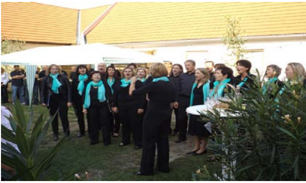
Cantate Domino aus Ternitz