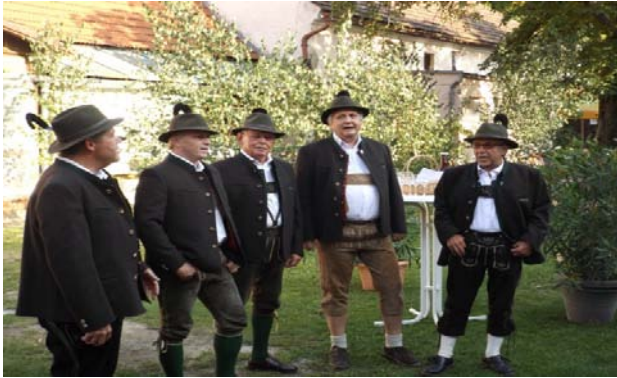
Männer DQ Almawind aus Piesting